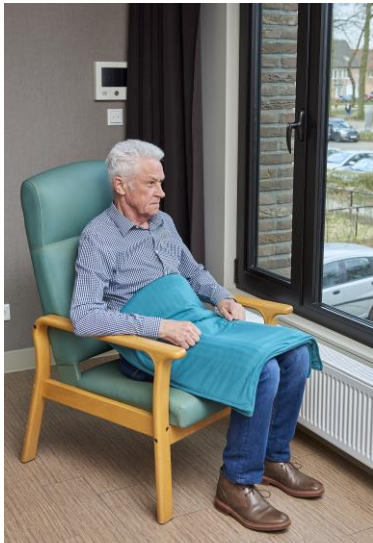
Md 40331/3 TS : Dagdeken in kwal. 1010, kleur: blauw, afm. 125/70 cm, 3 kg

Het ontwerp van onze modellen is beschermd tegen namaak. TS