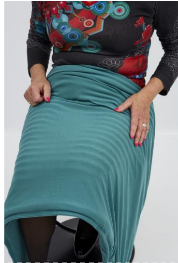
Md 40331/4,5 TS : Dagdeken in kwal. 1010, kleur: groen, afm. 125/70 cm, 4,5 kg.