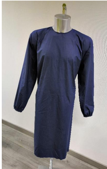
Md 172 DH devant