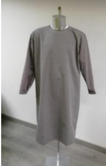
Md 172 DE devant

Tabliers de protection avec fermeture à boutons-pression au dos, lavables à 95°C.